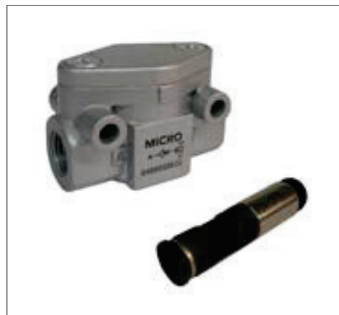
Códigos en Negrita : entrega inmediata, salvo ventas